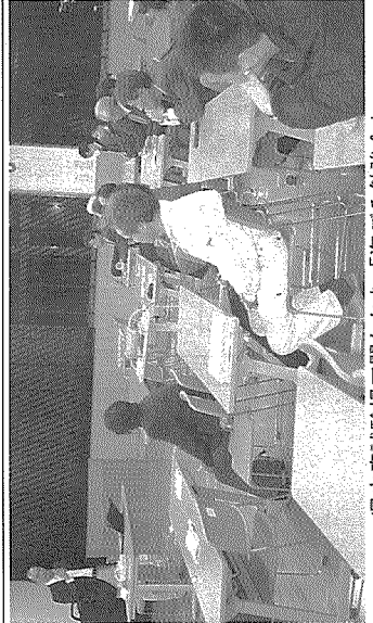
東水産試験場で開かれた「海こみ勉強会」

調べる太平洋は微小プラスチックの破片が最も多く、発達したプラスチック破片が動きやすい。九州に漂着する多量なプラスチック破片は韓国でカサの糞(日本国でカサの糞)に使用)の破片が多いことも判明した。ラッププロシエトは30都道府県、212海岸で調査、ラッププロシエとエチヤンタミの調査は一致するところがあった。そこで海まもろう会が及ぼす影響について、心準備・行動として維持している行動変化するのを仲間と一緒に一貫して行う」