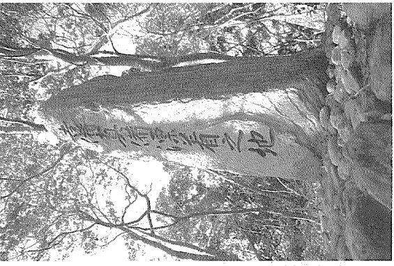
燈明崎に立つ「吉備真備漂着之地」の石碑

5〜775年)だ。熊野灘を望む燈明崎に「吉備真備漂着之地」の石碑が立つ。自身で度目の遣唐使に参加した真備は、帰途の天平勝雲5年(753年)、遭難して「紀伊国年瀬崎」に漂着したと「続日本紀」にある。彼の一族の与呂子右衛門がこの地に